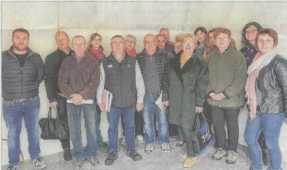
L'équipe municipale, des professionnels de santé et les bénévoles de l'ADMR ont visité le bâtiment, en compagnie du chef de chantier de la Semcoda et du cabinet d'architectes.

Parallèlement, la commune entreprend la restauration de la maison mitoyenne, dite "Maison Ramu". Elle sera, elle aussi, livrée début 2019. Avec, au rez-de-chaussée, un cabinet médical destiné à accueillir un troisième généraliste et d'autres professionnels de santé, et au premier étage, un appartement.