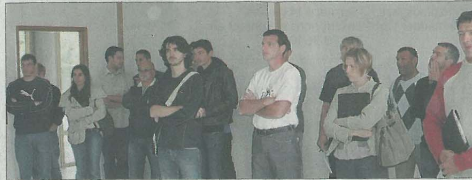
Les participants, dans les murs de la future école.

Ce fut le cabinet d'architecture Jean-François Benoît qui fut distingué par la commune